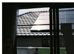
原告の目線にあるパネル

えるまぶしさで、日常生活に支障をきたしているとの事で横浜地裁はパネル撤去を命じました。