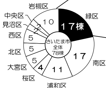
耐震診断件数 (平成20年度)