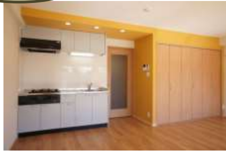
間取り変更 新規内装