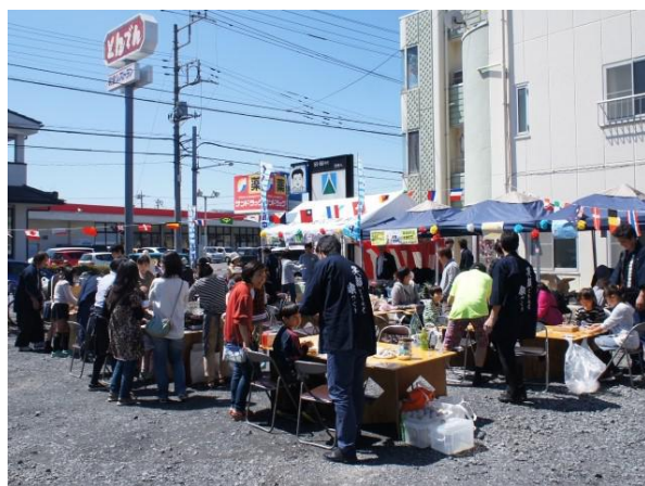
毎回大変賑わう一大イベント