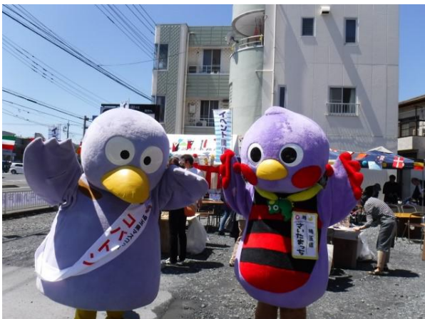
コバトン・さいたまっち参上