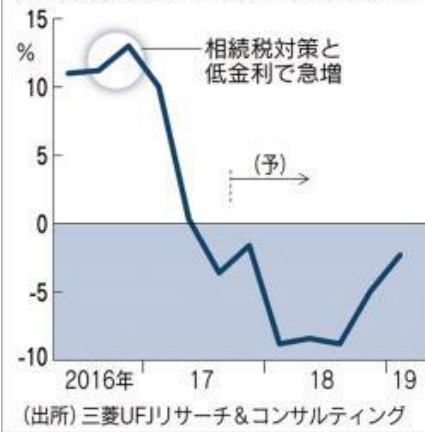
アパート建設が急速に落ち込んでいる (貸家の新設着工戸数、前年同期比増減率)

アパートバブルを引っ張ったのは地銀勢です。日銀のマイナス金利で稼げなくなり、収益を穴埋めするために一斉にアパート融資に動きまわりました。「土地持ちの地主にアパート営業をかける」を合言葉に、全国の地銀が一斉に貸し出しました。金融庁は節税効果を強調し将来の空室リスクを十分に説明しないなど顧客を軽視した姿勢を問題視しています。